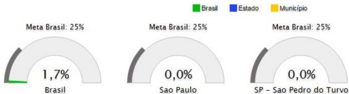
Figura 10. Percentual de matrículas de educação de jovens e adultos na forma integrada à educação profissional