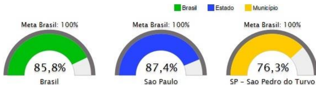
Figura 11. . Percentual da população de 4 a 17 anos com deficiência que frequenta a escola

a) Percentual da população de 4 a 17 anos com deficiência que frequenta a escola: