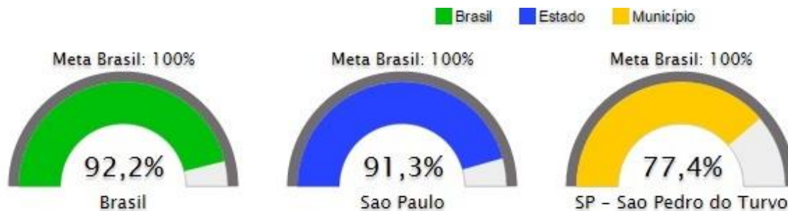
Figura 15. Razão entre a escolaridade média da população negra e da população não-negra de 18 a 29 anos

c) Razão entre a escolaridade média da população negra e da população não-negra de 18 a 29 anos: