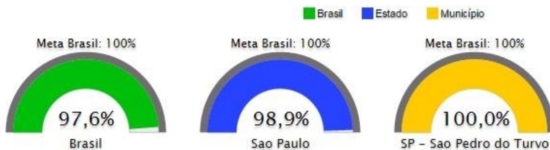
Figura 5. Taxa de alfabetização de crianças que concluíram o 3º. ano fundamental

a) Taxa de alfabetização de crianças que concluíram o 3º. (terceiro) ano fundamental: