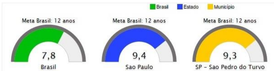
Figura 13. Escolaridade média da população de 18 a 29 anos residentes na área rural

b) Escolaridade média da população de 18 a 29 anos residentes na área rural: