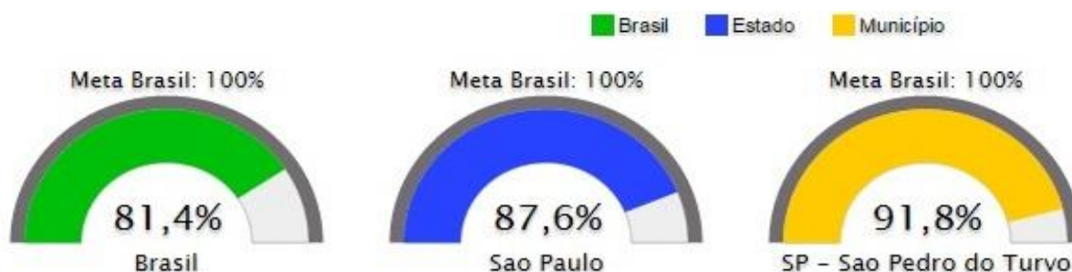
Figura 2. Percentual da população de 4 a 5 anos que frequenta escola