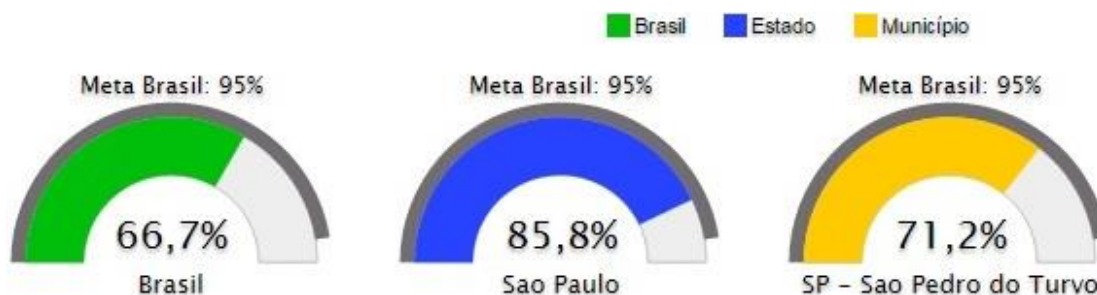
Figura 4. Percentual de pessoas de 16 anos com pelo menos o ensino fundamental concluído

b) Percentual de pessoas de 16 anos com pelo menos o ensino fundamental concluído