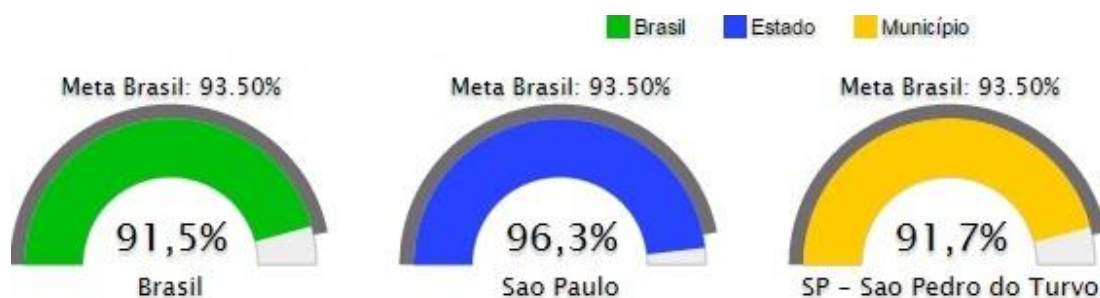
Figura 8. Taxa de alfabetização da população de 15 anos ou mais de idade