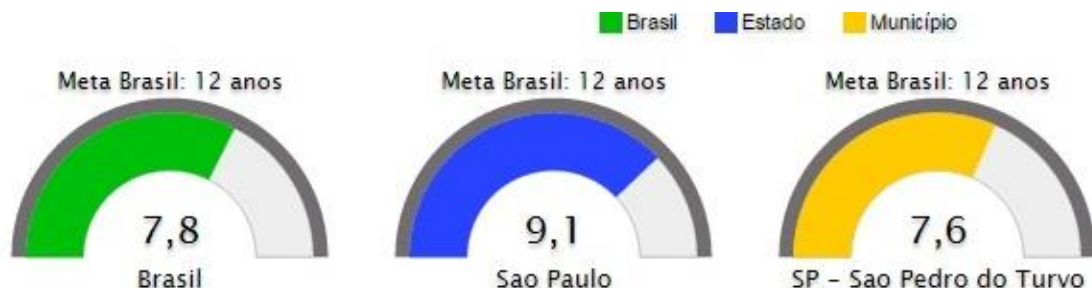
Figura 14. Escolaridade média da população de 18 a 29 anos entre os 25% mais pobres

c) Escolaridade média da população de 18 a 29 anos entre os 25% mais pobres: