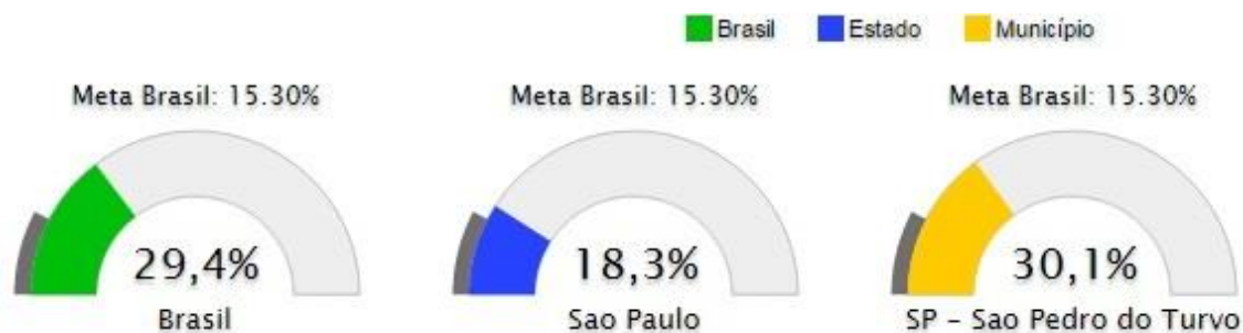
Figura 9. Taxa de analfabetismo funcional da população de 15 anos ou mais de idade