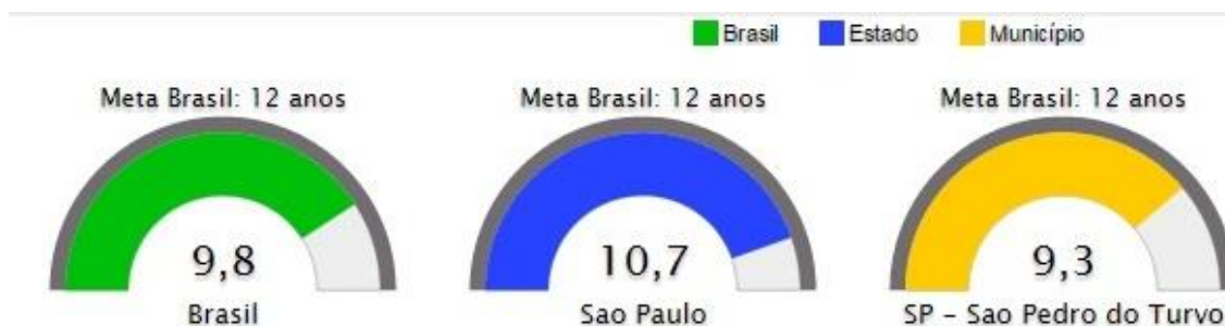
Figura 12. Escolaridade média da população de 18 a 29 anos Fonte: INEP, 2013

a) Escolaridade média da população de 18 a 29 anos;