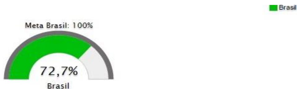
Figura 17. Razão entre salários dos professores da educação básica na rede pública (não-federal), e não professores, com escolaridade equivalente Fonte: INEP, 2013