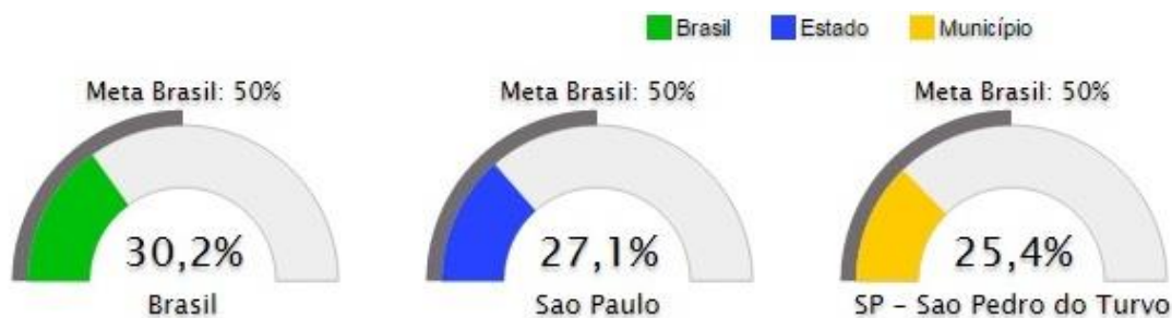
Figura 16. Percentual de professores da educação básica com pós-graduação lato sensu e stricto sensu

Percentual de professores da educação básica com pós-graduação lato sensu ou stricto sensu: